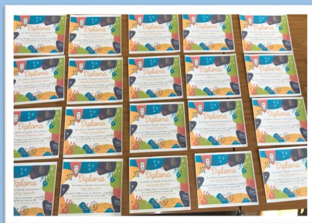
Diplomas de participación