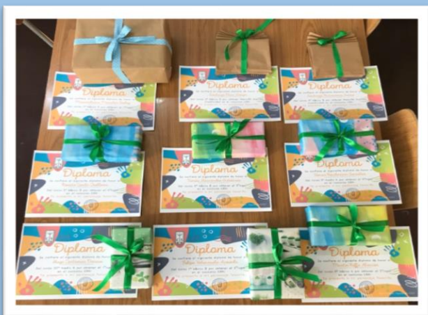
Premios y diplomas de honor

El día lunes 10 del presente mes tuvimos el agrado de realizar en nuestro establecimiento, Colegio El Salvador, la premiación de los alumnos ganadores del segundo concurso organizado por el Centro de Recursos para el Aprendizaje (CRA), titulado Te presento a mi personaje favorito . En esta oportunidad, debido a la contingencia sanitaria, se solicitó únicamente la asistencia de los apoderados de los ganadores. Además, se reconoció la participación de nuestros alumnos mediante la entrega de diplomas a cada uno de estos. A continuación, presentamos las fotografías de la premiación: